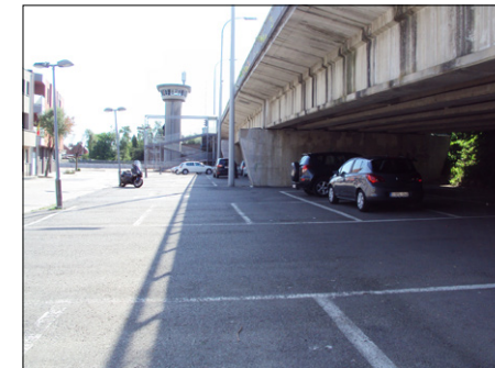
P2: Parking Viaduct (Kanunnik Muyldermanslaan)