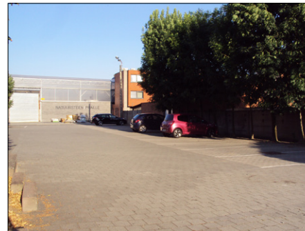
P1: Parking Bibliotheek (Pastoriestraat)