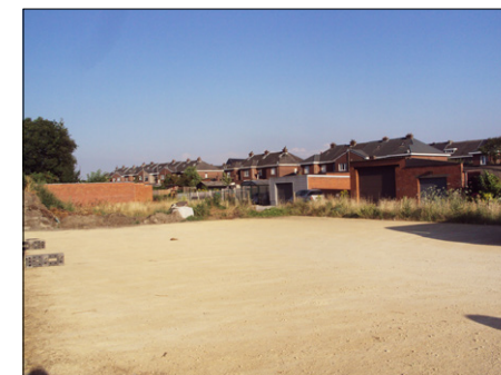
P6: Parking Magazijn (Kerselaarlaan)

De locatie van bovenstaande parkeerterreinen is aangeduid op het stratenplan op de achterzijde van deze folder.