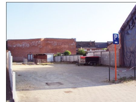
P4: Parking Zwembad (kant Kerselaarlaan)