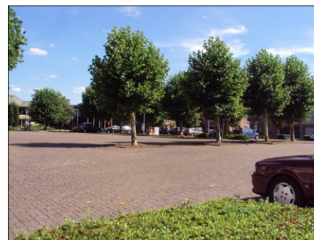
P5: Parking Marktpluin