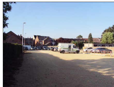
P3: Parking Kring (Mechelseweg nr. 100)